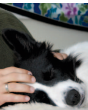
TTouch® baut Vertrauen auf

Der „Tellington-TTouch®“ bei dem die Haut in einem 1 ¼ Kreis gegen das darunter liegende Gewebe verschoben wird, hat eine positive Wirkung auf die Muskulatur, das Nervensystem und auf jede einzelne Körperzelle. Die Wirkungsweise ist durch verschiedenste Tests wissenschaftlich belegt. Probieren sie es selbst aus oder besuchen sie einen Workshop.