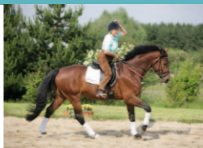
Mehr Leistung und Spass mit der Tellington-Methode

DIESE METHODE basiert auf dem Prinzip des Verstehens von Ursache und Wirkung und der daraus abgestimmten Anwendung von „Tellington-TTouch® und „Bodenarbeit“. Bei den Pferden können durch das „Reiten mit Freude“ zusätzlich erstaunliche Ergebnisse erzielt werden, die in vielen Fallgeschichten dokumentiert sind. Die Tellington-Philosophie sowie das Tellington-Reit-equipment sind darauf ausgerichtet, die Hinterhand zu aktivieren, die Rückenaktivität zu verbessern und eine runde harmonische Oberlinie zu fördern. Leistungssteigerung, Freude und Balance sind die natürliche Folge davon.